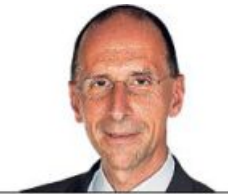
PROF. PETER FILZMAIER

Im EU-Wahlkampf gibt es schwere Vorwürfe gegen die grüne Kandidatin Lena Schilling. Sie soll verleumderische Aussagen über ein befreundetes Paar getätigt haben. Frau Schilling und ihre Parteispitzen dementieren das energisch als „Gefurze“. Wie ist das aber überhaupt mit Quereinsteigern, wie Schilling eine ist?